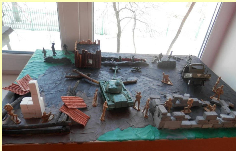
Выставка детских работ